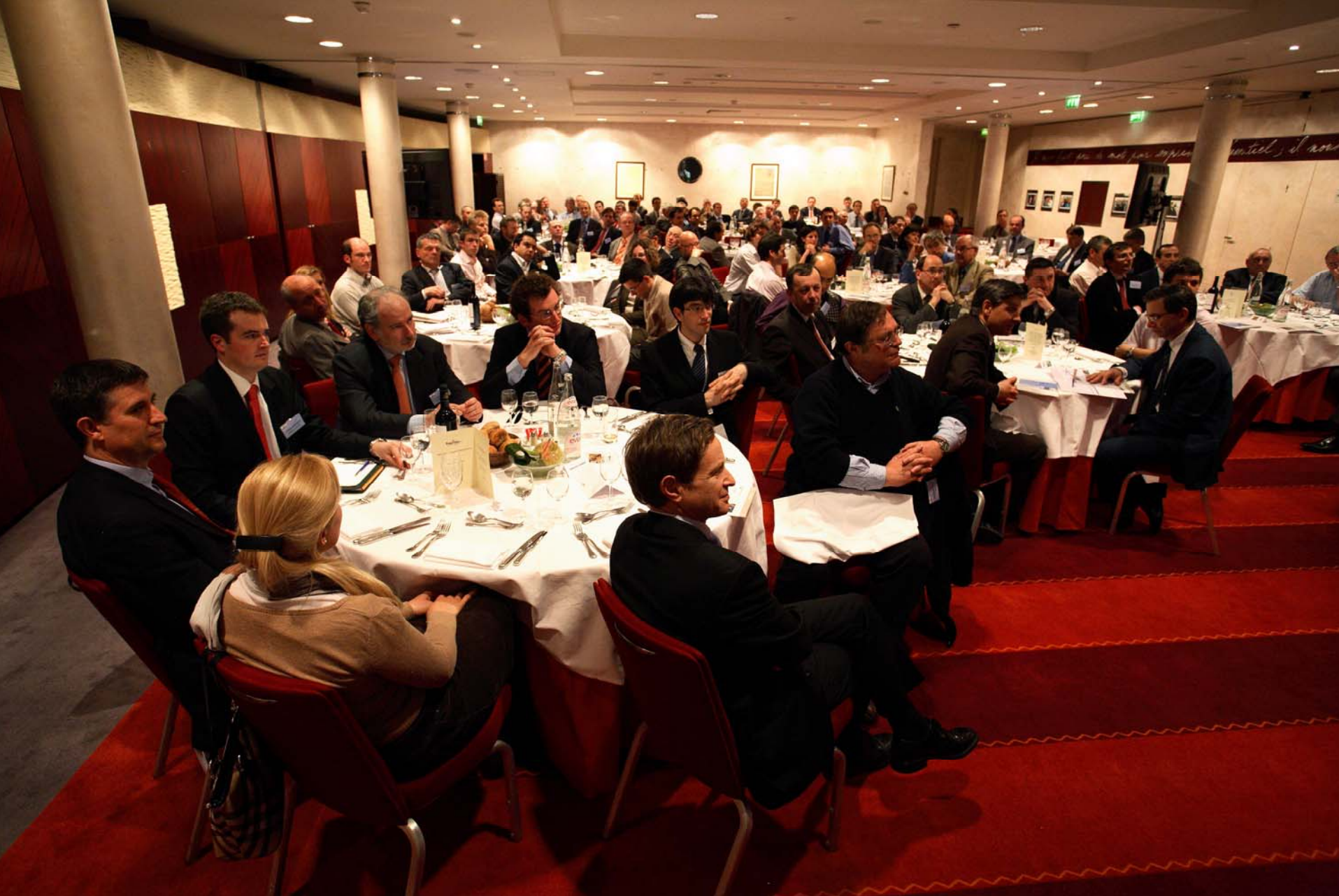
Une assistance nombreuse et attentive a participé à cette conférence.