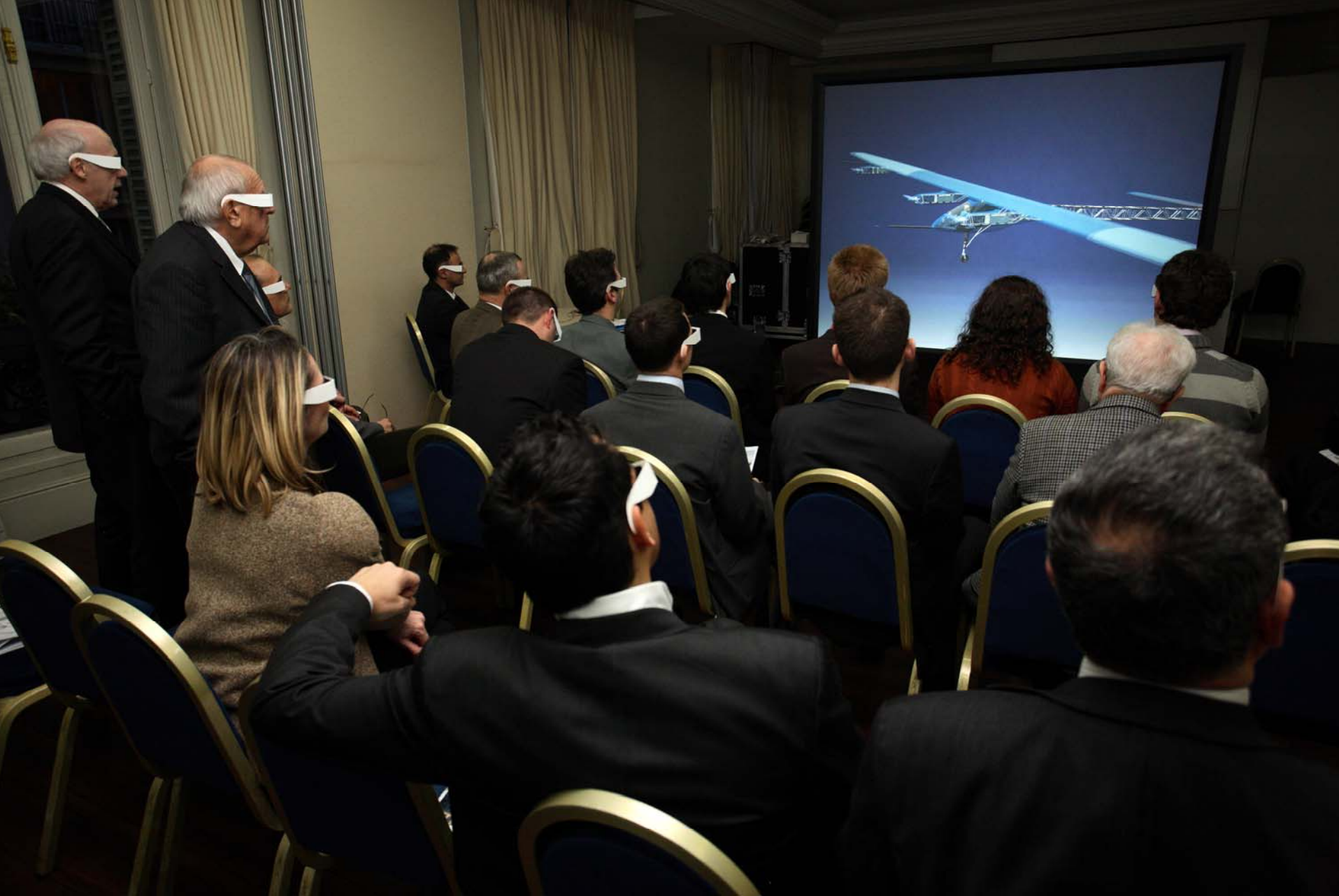
Démonstration de la maquette numérique du Solar Impulse grâce à un système de réalité virtuelle portable.